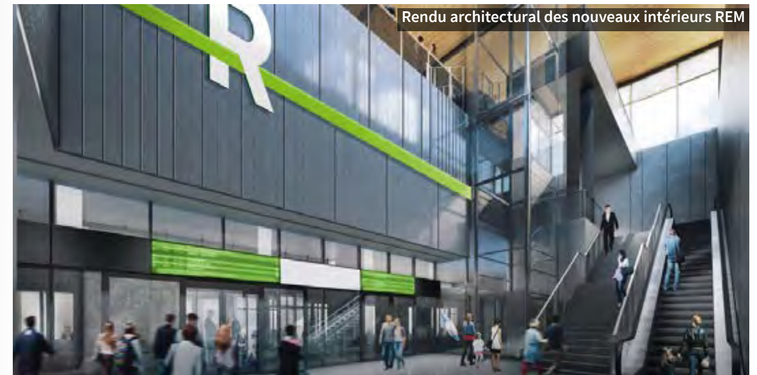
Rendu architectural des nouveaux intérieurs REM